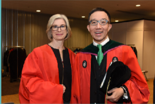
珍妮花·杜德納教授（左）與港大醫學院院長梁卓偉教授合照

杜德納教授與其同事在2012年發表了有「上帝的手術刀」之稱的基因編輯技術。這項技術使科學家有辦法精準對動物、植物、微生物的基因進行編輯，其廣泛的應用潛力獲得各界重視。